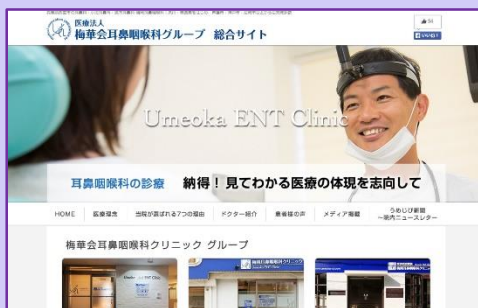
当院ホームページ 総合サイト

今回ゴツホの事を調べていて、ゴツホの作品の印象がガラッと変わりました（°ω°） 私は作品を、「綺麗」「すごい」「こんな風に表現できたら楽しいだろうな...」と、絵を 見ただけでしか判断していませんでしたが、その人の性格や人生など、違う視点も 合わせてみると、今まで見た作品も、違ったモノに見えて楽しいですね！（^o^） これから作品を見るときは、そういったことも意識してみたいと思います☆（・ω・）